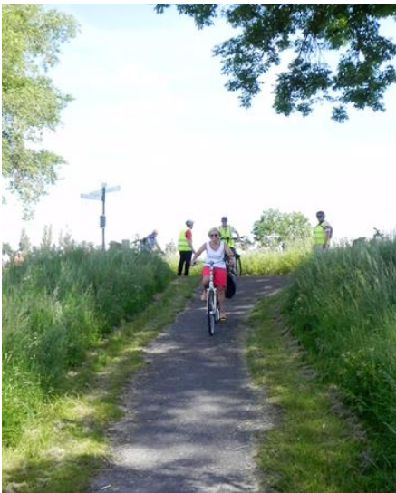
De duik /dijk naar beneden

Terug op de fiets moesten we enkele honderden meter verder langs het kanaal een duik naar beneden maken naar de veel lager gelegen velden en akkers om onze tocht te kunnen verderzetten. Die hindernis werd evenwel door iedereen met succes genomen. Ter hoogte van het gehucht Strooienhaan en wat verder het brugje over de Blankenbergsevaart en langs het Hagebos werd de laatste 'rechte lijn' ingezet richting Zuienkerke. Wat het einde was van een aangename en gezellige fietsnamiddag.