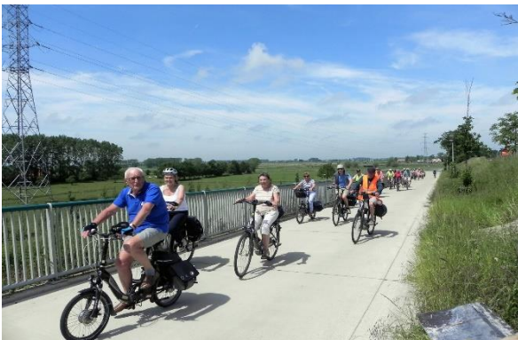
De Jonckheerebrug over het kanaal naar Oostende

We fietsten op zeer rustige wegen door of langs de polderdorpjes Meetkerke, Houtave (met op het dorpsplein de authentieke herberg 'De Drie Koningen') en Stalhille. Langs het kanaal Gent-Oostende konden we genieten van ongehinderde polderzichten en een natuur die voor de nodige rust zorgde. Via de nieuwe fietsersbrug over het kanaal kwamen we op grondgebied Sint -Andries en konden we koers zetten richting Stalhillebrug waar we verwacht werden om te genieten van een pannenkoek en koffie in 'Ter Spinde'.