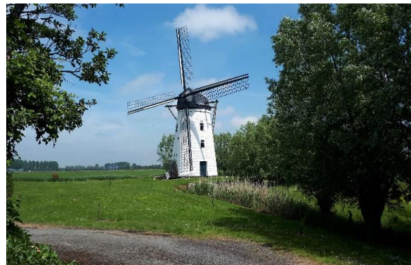
De Grote Molen van Meetkerke